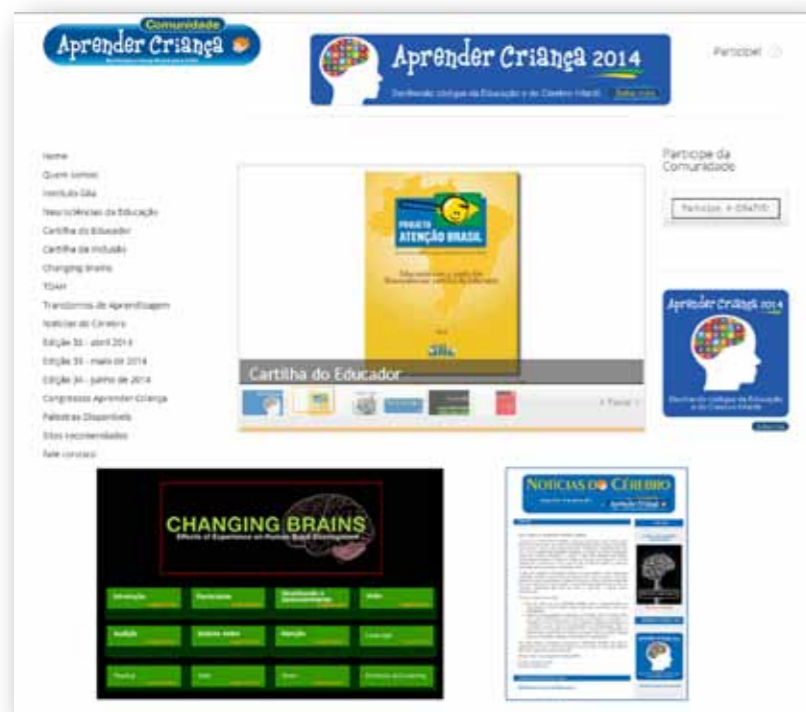
Portal da Comunidade Aprender Criança www.aprendercrianca.com.br

Entre as contribuições mais importantes da Comunidade Aprender Criança destaca-se o Projeto Atenção Brasil 19 , um amplo e inédito estudo populacional iniciado em 2009 e ainda em andamento, realizado a partir de uma amostra final de 5.961 crianças e adolescentes de 87 cidades e 18 estados, cobrindo as cinco regiões nacionais. Com a participação voluntária de mais de mil membros da Comunidade, após planejamento amostral cuidadoso, foram selecionados 124 professores que representavam adequadamente a distribuição demográfica da população infantil Brasileira. Esses professores foram treinados via internet em como selecionar a amostra e aplicar os questionários aos pais e professores. A fase inicial do projeto resultou em mais de duas dezenas de artigos científicos publicados em revistas indexadas, além de prêmios em congressos nacionais e internacionais. No entanto, há que se destacar o fruto mais importante desse estudo, a “Cartilha do Educador: educando com a ajuda das Neurociências” 20 .