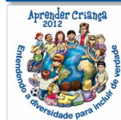
Logolemas dos congressos bianuais Aprender Criança desde 2006.