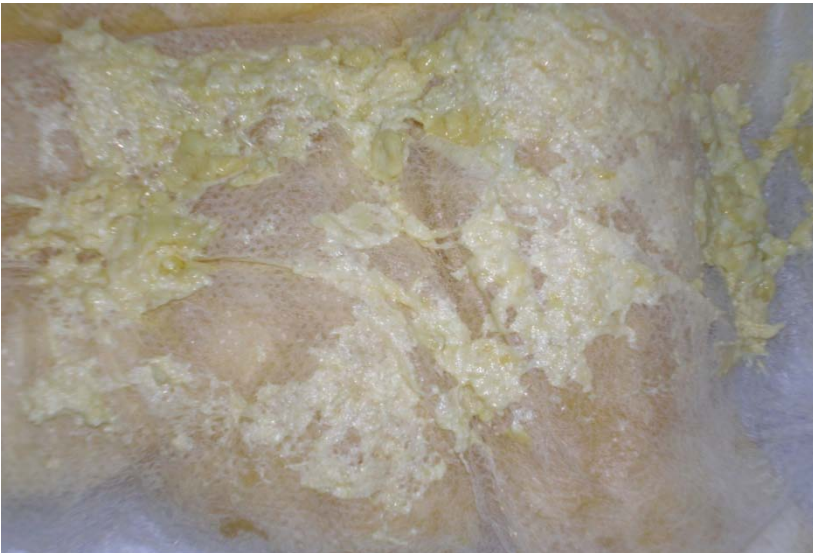
Figura 3 – Acolia fecal e colúria em fralda de lactente portador de atresia biliar.

Figura 2 - Escala cromática das cores das fezes. Estabelece as cores de fezes normais e as suspeitas, em relação à presença de hipocolia ou acolia fecal nos portadores de colestase neonatal.